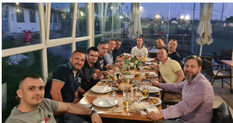
Gdje su vesla, 'ajde Tesla! A kada je dedu, Teslu ne zovedu.